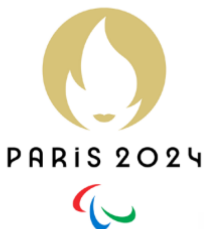
L'emblème des jeux paralympiques