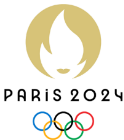
L'emblème des jeux olympiques

La devise est une conduite à suivre : donner le meilleur de soi-même et ne pas être forcément le premier. La devise des jeux paralympiques est « Spirit in motion » : ce qui veut dire « Esprit en mouvement ». Cela veut dire le dépassement de soi, pour donner le meilleur de soi-même et aller chercher le meilleur des autres.